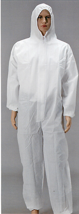
フード付きつなぎ服